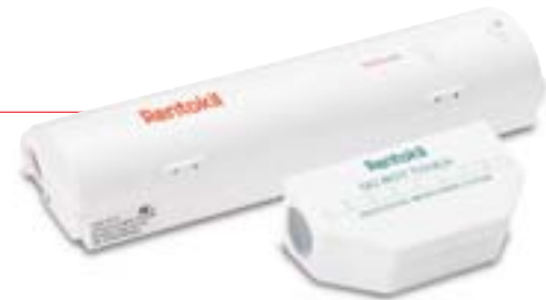
RADAR en Sentinel Non-tox: Oplossingen voor professionele knaagdierdetectie- en bestrijding.

Hightech producten, zoals RADAR, combineren zowel detectie als bestrijding door middel van elektronische bewaking en gelijktijdige bestrijding met CO 2 . Ideaal voor zeer gevoelige ruimtes van het gebouw en voor utility- en serverruimtes.