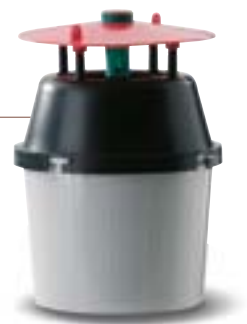
Feromoonval: Rentokil kan uw voorraden beschermen met uiterst effectieve detectie- en weringsystemen

onder meer detectievallen met soortspecifieke feromonen en feromoonvallen voor een doelmatige detectie en bestrijding van de plaagdieren, volgens hygiënerregels en HACCP-richtlijnen.