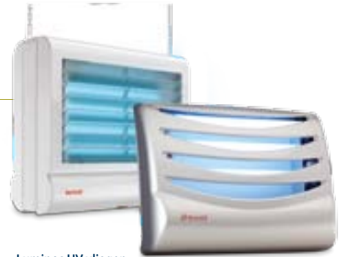
Luminos UV vliegen-vangers zijn efficiënt, stijlvol en discreet

De Luminos 4 insectenvangers zijn ontwikkeld voor bedrijfstoepassingen in gevoelige ruimtes. Ze zijn dankzij de zeer hoge vangpercentages veel effectiever en hygiënischer dan insectenvangers met hoogspanningsrooster. Onze methode om de effectiviteit te bepalen is getoetst door SINTEF, de onafhankelijke Scandinavische onderzoeksinstelling.