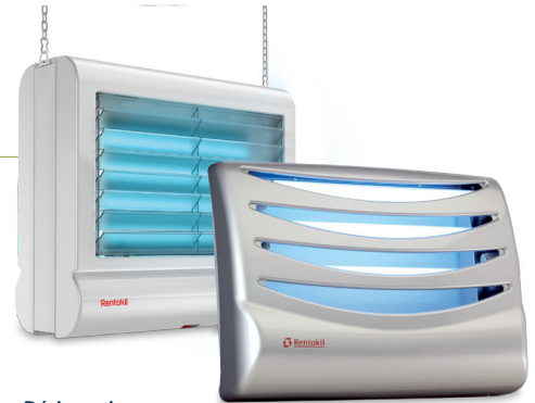
Désinsecteurs LUMINOS discrets et efficaces

Rentokil offre un large choix de Luminos conçus pour un usage professionnel à fixer au plafond ou au mur. Sur les terrasses et dans les zones extérieures, nous protégeons vos patients, les visiteurs et vos employés avec des pièges à guêpes professionnels et nous éliminons les nids de guêpes sur demande.