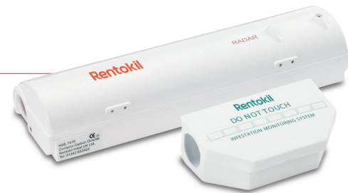
RADAR et MONITOR : Unités non toxiques brevetées pour les zones sensibles

et de traitements en fonction de votre problématique. Cette approche évite les migrations de rongeurs dans des zones sensibles de préparation et de stockage d'aliments. Nos solutions de surveillance garantissent une détection précoce de toute activité de nuisibles. A la pointe de la technologie, le RADAR combine détection électronique et éradication immédiate au CO 2 . Votre technicien Rentokil identifie les faiblesses du bâtiment pour une meilleure herméticité, comme les fissures ou les trous dans les murs, les plafonds et les portes pouvant laisser passer les rongeurs. C'est par une prévention minutieuse que votre établissement sera protégé au mieux.